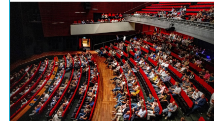
Bron: NOS, 21 mei 2022

Waar blijft het publiek? Cultuursector worstelt sinds corona