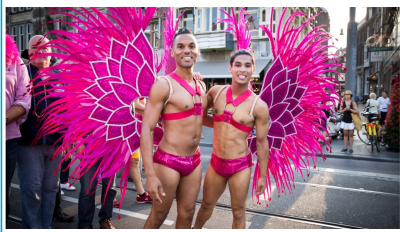
Bron: MarketingTribune, 31 juli 2023

Onderzoek: 'Helft Nederlanders vindt Pride te pikant'