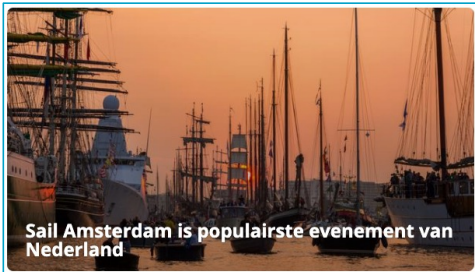
Sail Amsterdam is populairste evenement van Nederland