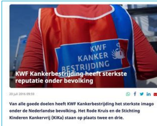
Bron: nu.nl, 20 juli 2016