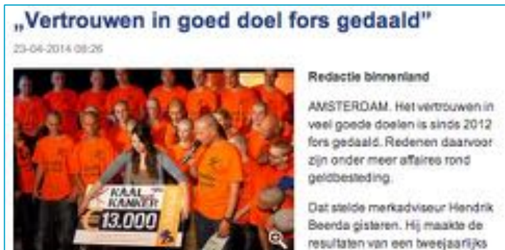
Bron: Reformatorisch Dagblad, 23 april 2014